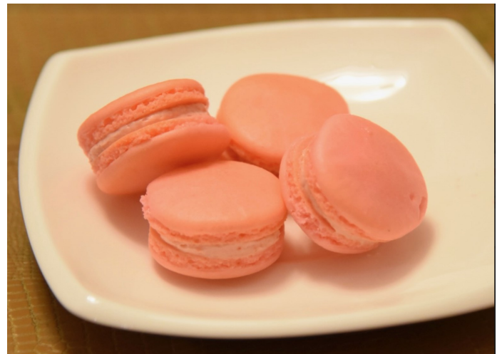
我的非常少数的成功之一。