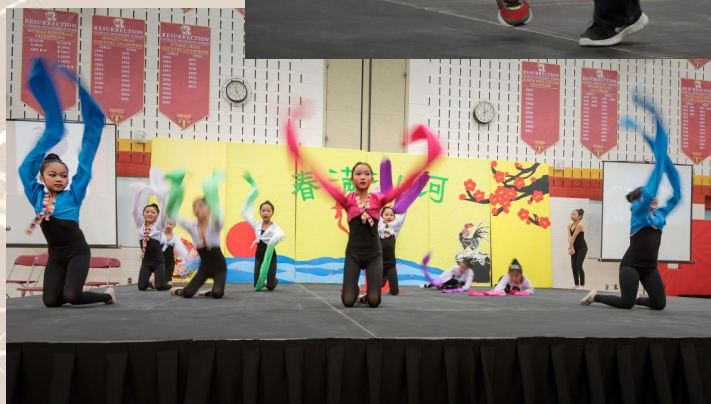
舞蹈三班演出的《舞之韵》