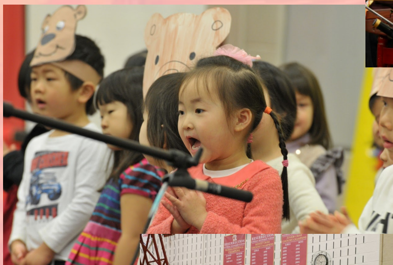
四岁班的小朋友在表演