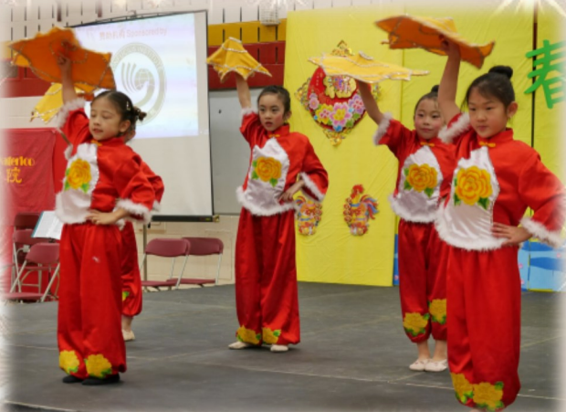
舞蹈二班演出的《开门红》

歌声稚嫩，舞姿欢快。同学们用自己认真的表演赢得了阵阵掌声，每一个同学都是今天的主角！在欢乐热闹的气氛中，不知不觉中四个小时就过去了，大家都还意犹未尽。