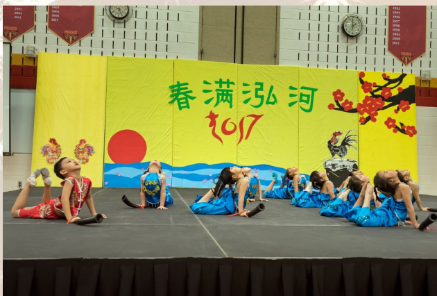
舞蹈一班演出的《小螺号》