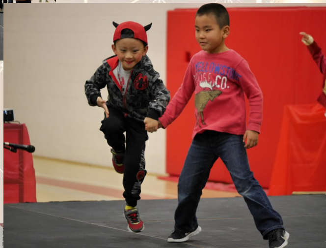
五岁班演出的《时装表演》