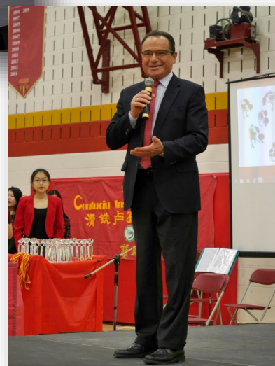
国会议员Harold Albrecht 致辞