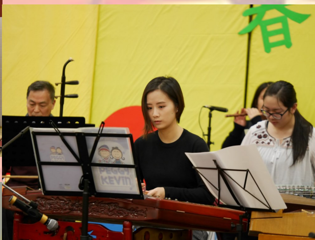
滑铁卢民乐团在演奏