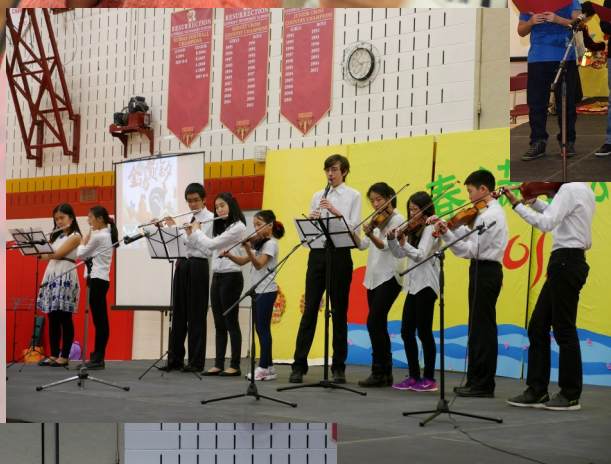
中文学校的乐团在演奏