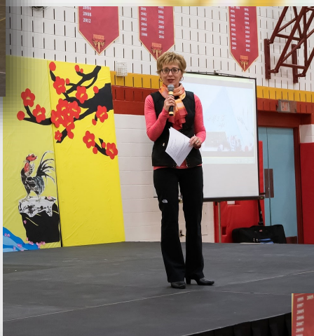
省议员Daiene Vernile 致辞