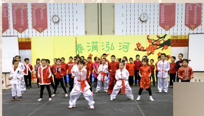
二年级演出的《中华武术操》