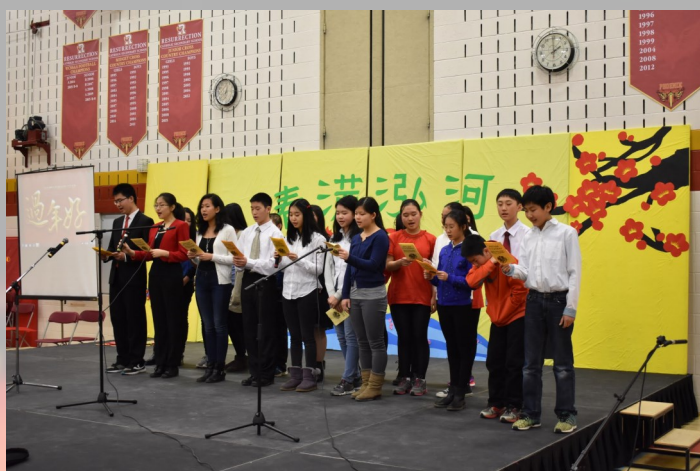
中文学校学生会的同学们演唱校歌