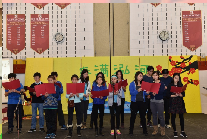
八年级同学在表演