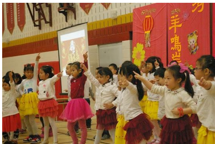
五岁班小朋友表演的《小苹果》