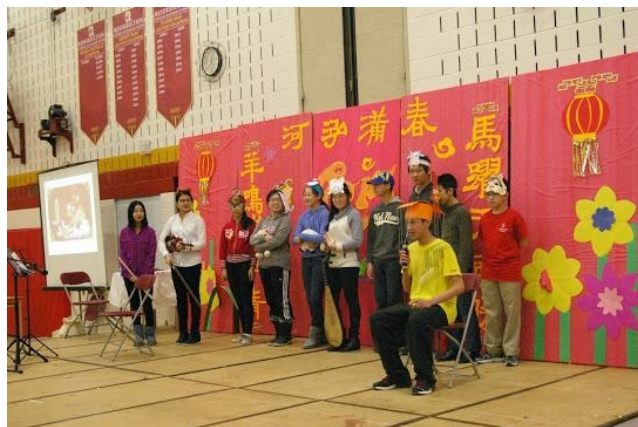
学分一班的同学表演《十二生肖争排名》