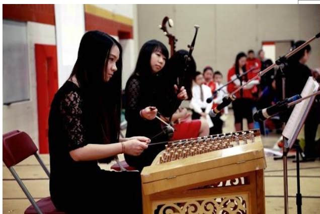
龙韵国乐团带来了精彩的中外名曲