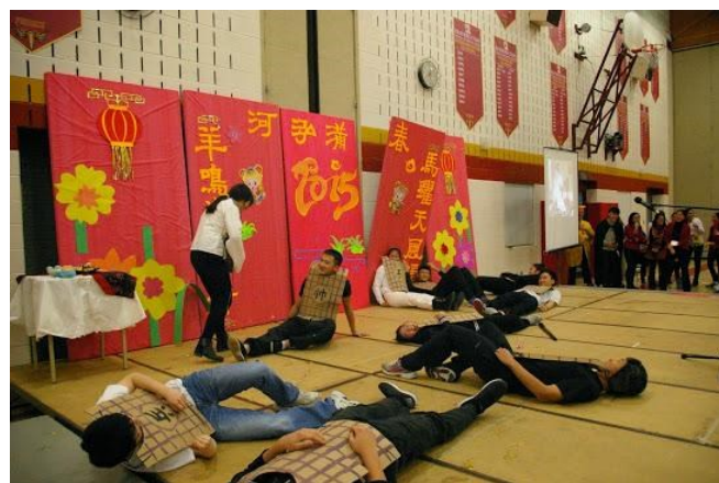
学分二班表演的短剧《花木兰》