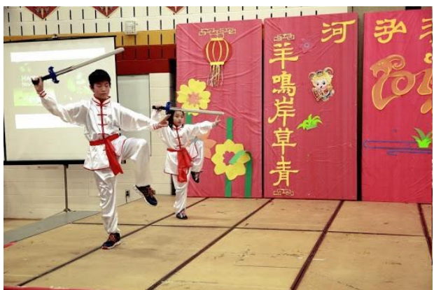
剑术班的同学表演的剑术