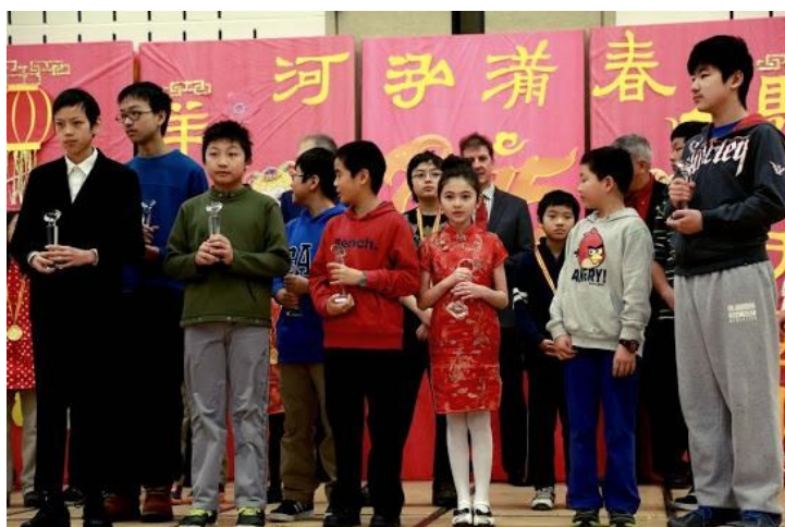
在数学和作文比赛中获奖的同学领奖