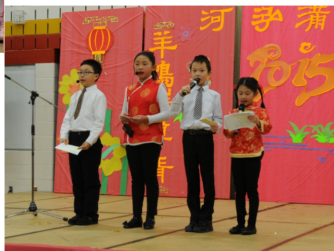
羊年联欢会的四位主持人