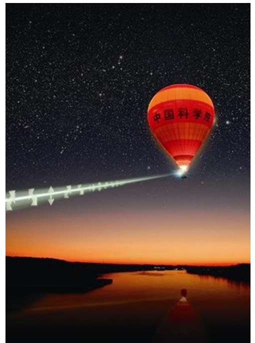
中科院成功完成“星地量子通信”地基试验。（资料图）

在保密通信领域，量子通信以绝对安全、超大信息容量、超高通信速率、超远距离传输等特点，被全球科技界、产业界视为继微电子信息之后，极有可能引发军事、经济、社会领域又一次重大革命的关键技术。它同时也是迄今为止唯一被严格证明是“无条件安全”的通信方式，可以从根本上解决国防、金融、商业等领域的信息安全问题。（摘自新华网）