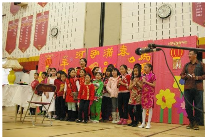
四年级表演的《时间都去哪儿了》