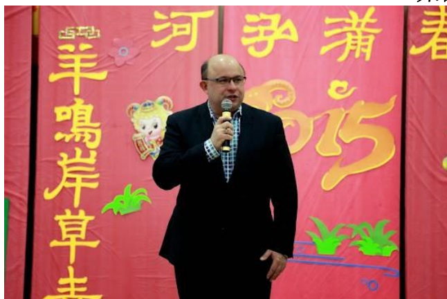
Kitchener市长Berry Vrbanovic 致辞