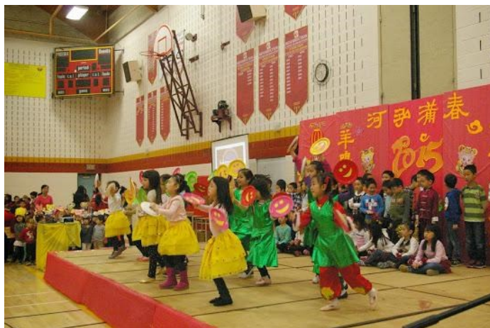
一年级同学表演的歌舞《爸爸妈妈小时候的歌》