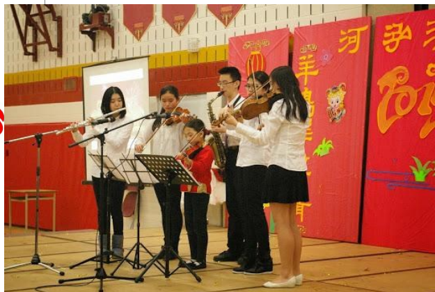
泓河学生乐团在表演《青花瓷》