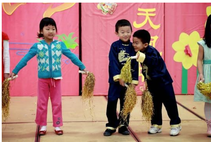
分校三、四、五岁班表演的律动《彩虹的约定》