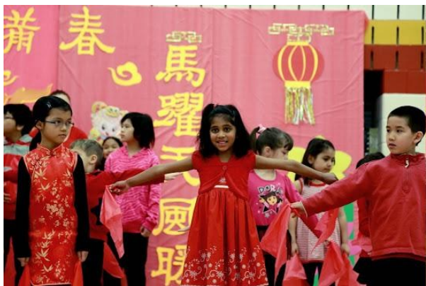
学分班表演的《新年好》