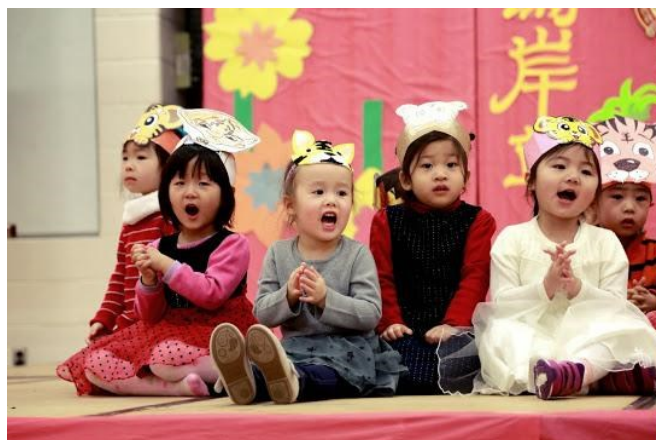
三岁班小朋友演唱《两只老虎》